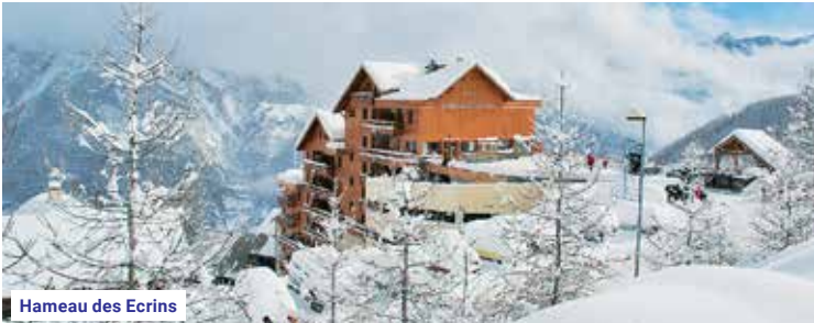
Hameau des Ecrins