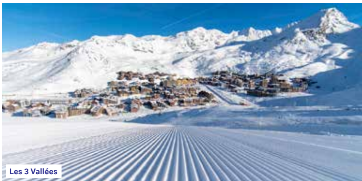
Les 3 Vallées