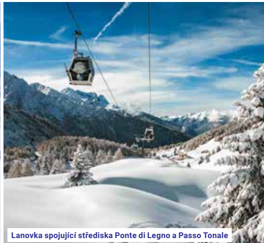
Lanovka spojující střediska Ponte di Legno a Passo Tonale