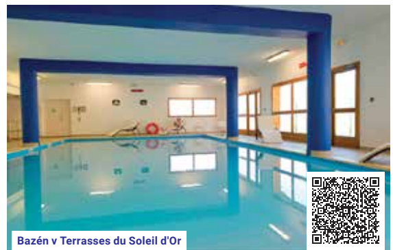
Bazén v Terrasses du Soleil d'Or

Cena v tabulce zahrnuje: 7x ubytování na vč. spotřebě vody a energie • 6denní skipas pro oblast Les Orres • pojištění CK proti úpadku Cena v tabulce nezahrnuje: dopravu lux. busem (viz str. 6–7) • pobytovou taxu • cestovní pojištění (viz str. 5) • povlečení • ručníky • čisticí a hygienické prostředky • průběžný a závěrečný úklid • kauci na apartmán