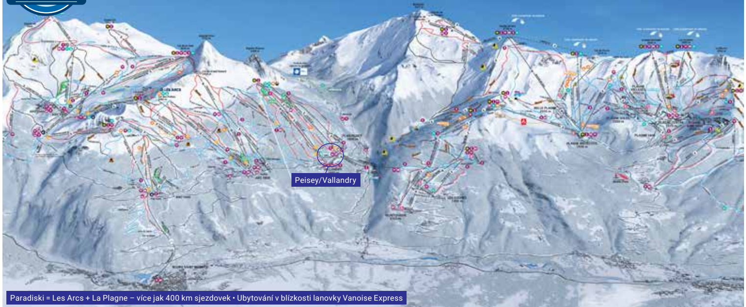
Paradiski = Les Arcs + La Plagne – více jak 400 sjezdovek • Ubytování v blízkosti lanovky Vanoise Express

FIRST MINUTE 5% do 31. 10. 3% do 30. 11.