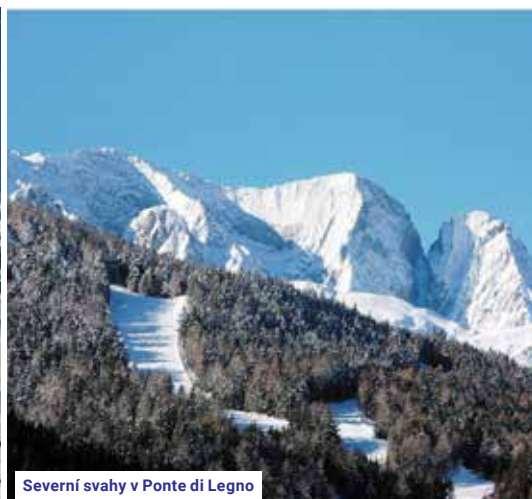
Severní svahy v Ponte di Legno