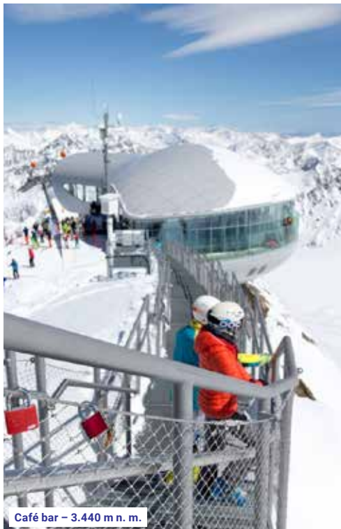
Café bar – 3.440 m n. m.