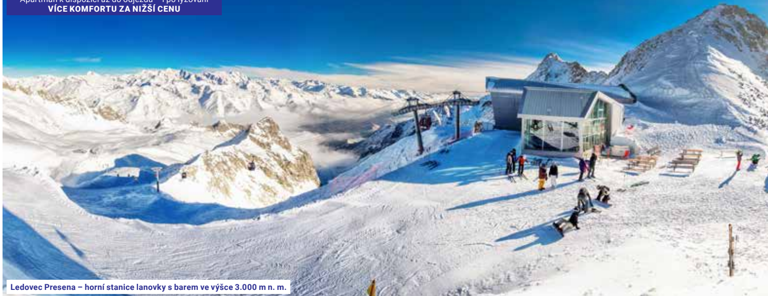
Ledovec Presena – horní stanice lanovky s barem ve výšce 3.000 m n. m.

Cesta tam bez nočního přejezdu – na svah odpočatí Ubytování ihned po příjezdu – bez nepříjemného čekání Apartmán k dispozici až do odjezdu – i po lyžování VÍCE KOMFORTU ZA NIŽŠÍ CENU