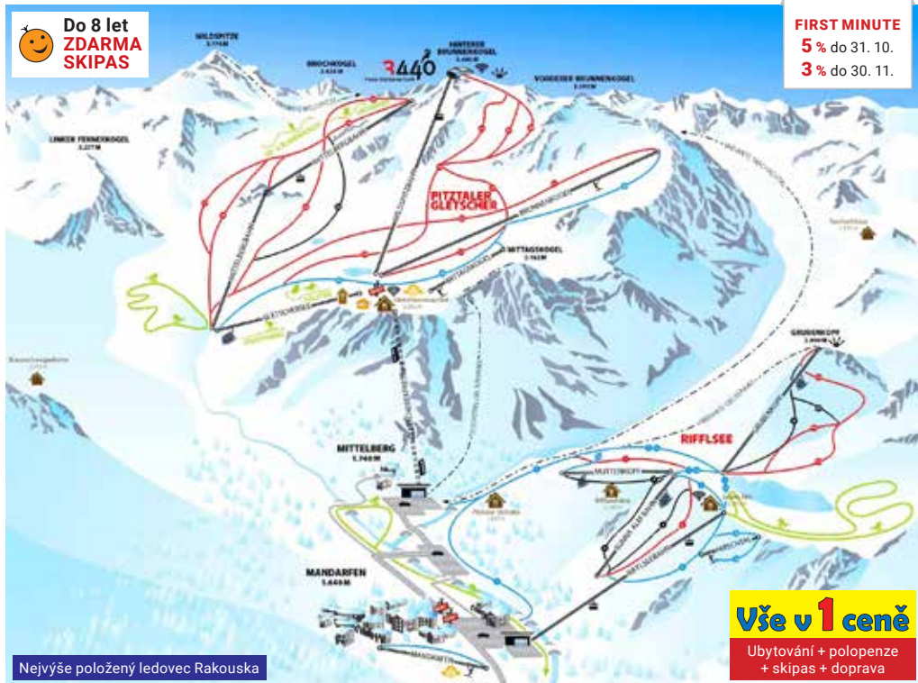
Nejvýše položený ledovec Rakouska