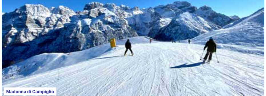
Madonna di Campiglio

Další možnosti střediska: lázně a wellness centrum „Il Borgo della salute“ – pro klienty CK Victoria 10% sleva na vstupné