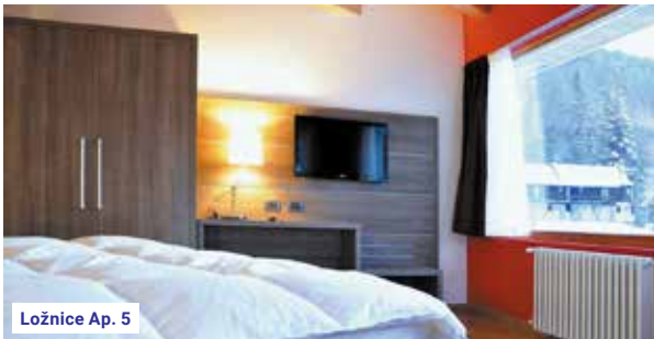
Ložnice Ap. 5