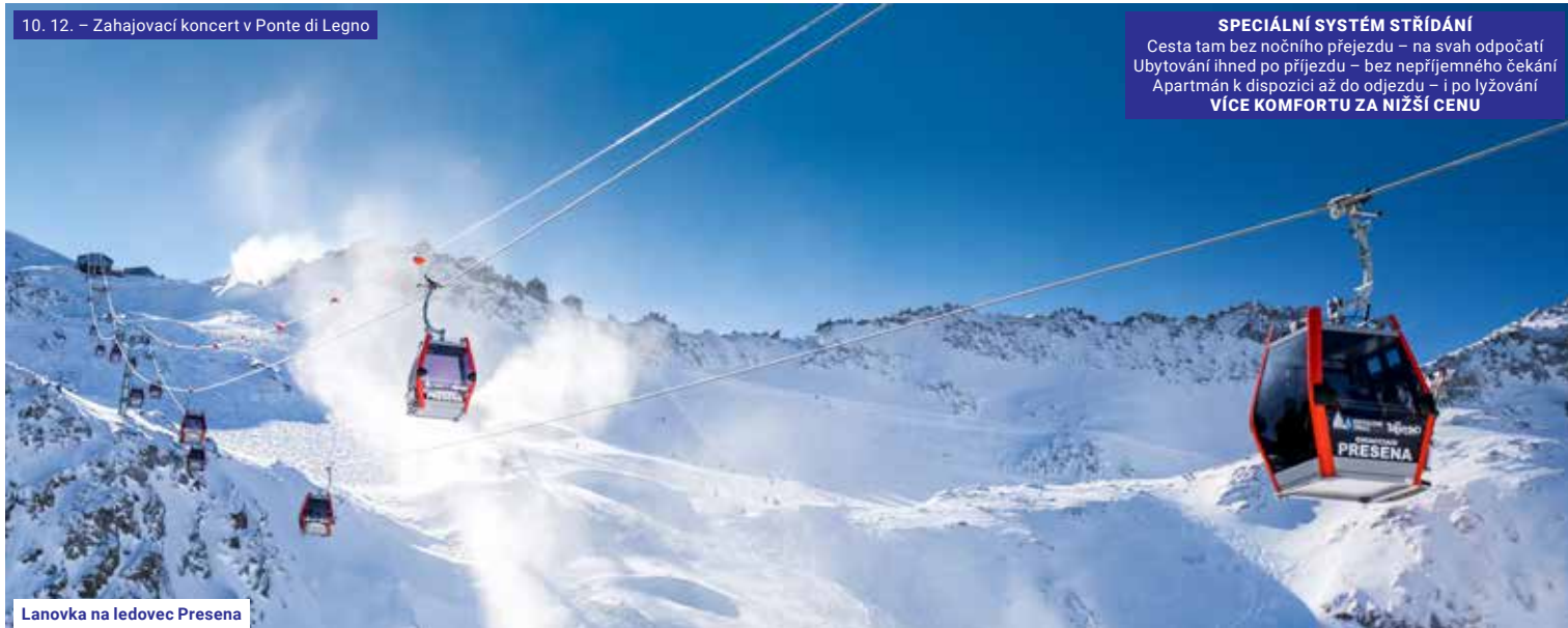
Lanovka na ledovce Presena

Cesta tam bez nočního přejezdu – na svah odpočatí Ubytování ihned po příjezdu – bez nepřijemného čekání Apartmán k dispozici až do odjezdu – i po lyžování VÍCE KOMFORTU ZA NIŽŠÍ CENU