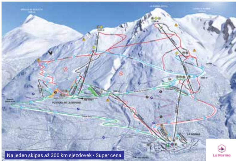
Na jeden skipas až 300 km sjezdovek • Super cena