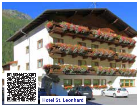
Hotel St. Leonhard