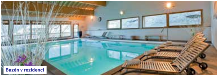
Bazén v rezidenci

Slevy: • Sleva za včasný nákup: • 5% záloha do 31. 10. 2022 • 3% záloha do 30. 11. 2022 • Sleva za věrnost – zákaznická karta (viz str. 3) • Dítě do 5 let, senior 75+ a nelyžař –3.500 Kč • Slevy pro skupiny viz katalog Kolektivy 2023 Příplatky: • Svaz do Brna, odjezdová místa, časy odjezdů a příplatky (viz str. 7) • Sedadlo v autobuse navíc +2.500 Kč • Parking na terminálu CK po dobu zájezdu +800 Kč/auto