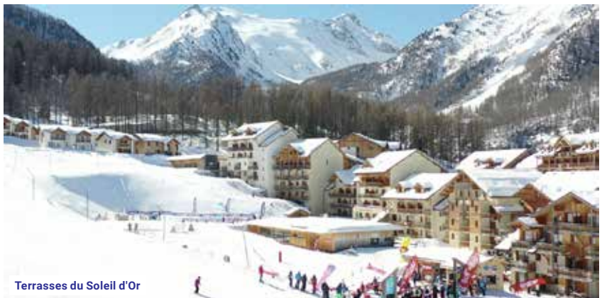
Terrasses du Soleil d'Or

Další možnosti střediska: paragliding, bowling, skijoring, skútry, kluziště, bobová dráha, skibus po středisku