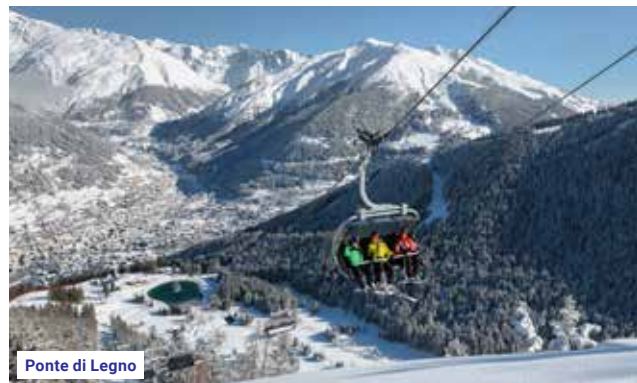
Ponte di Legno

10. 12. – Zahajovací koncert v Ponte di Legno