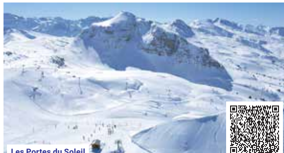
Les Portes du Soleil

Cena v tabulce nezahrnuje: dopravu lux. busem (viz str. 6–7) • pobytovou taxu • cestovní pojištění (viz str. 5) • povlečení • ručníky • čistící a hygienické prostředky • průběžný a závěrečný úklid • kauci na apartmán