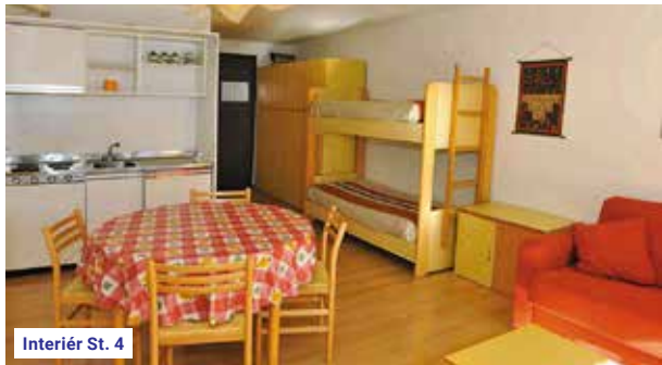
Interiér St. 4