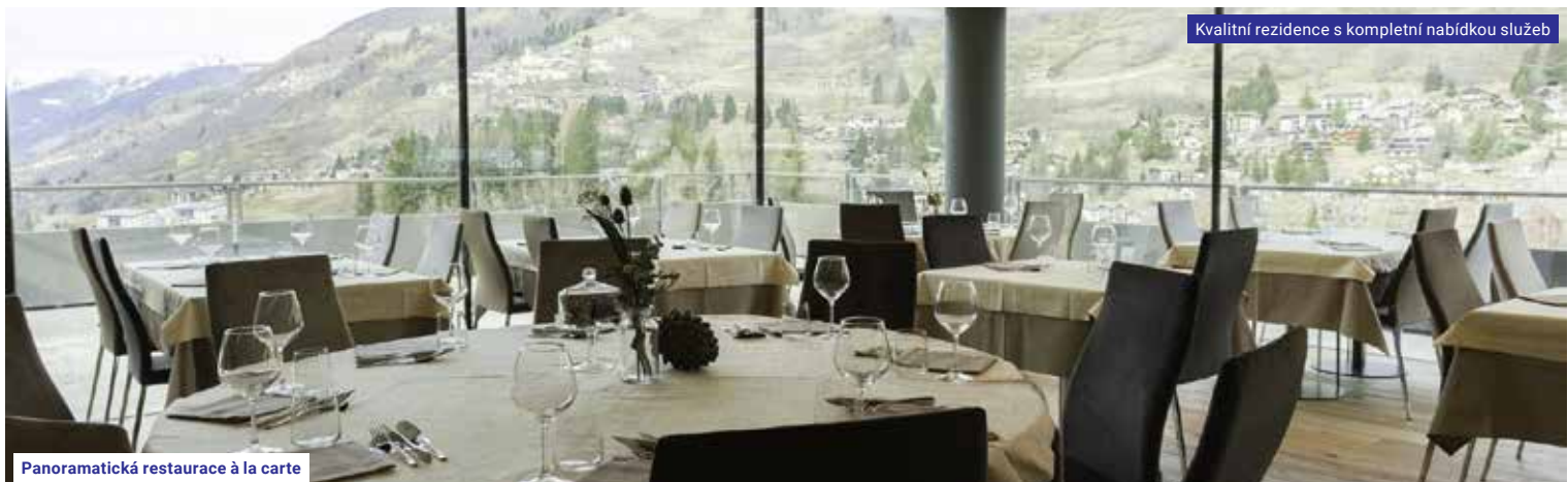
Panoramatická restaurace à la carte

Kvalitní rezidence s kompletní nabídkou služeb