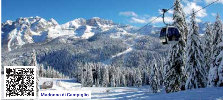
Madonna di Campiglio

Slevy: • Sleva za včasný nákup: • 5% záloha do 31. 10. 2022 • 3% záloha do 30. 11. 2022 • Sleva za věrnost – zákaznická karta (viz str. 3) • Dítě do 8 let (nar. po 30. 4. 2014) –4.500 Kč • Jeden rodič může uplatnit pouze jednu dětskou slevu. • Junior do 16 let (nar. po 30. 4. 2006) –1.500 Kč • Sleva pro vlastní dopravu –1.000 Kč/os. Příplatky: • Jednolůžkový pokoj +3.000 Kč • Svovz do Brna, odjezdová místa, časy odjezdů a příplatky (viz str. 7) • Sedadlo v autobuse navíc +2.000 Kč • Parkování na terminálu CK +480 Kč/autobus