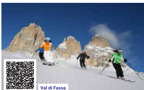
Val di Fassa

Cena v tabulce nezahrnuje: doprava lux. busem (viz str. 6–7) • pobytovou taxu • cestovní pojištění • povlečení • ručníky • čisticí a hygienické prostředky • skibus • kauce na apartmán