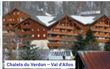
Chalets du Verdon – Val d'Allos