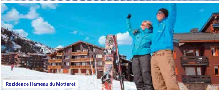
Rezidence Hameau du Mottaret