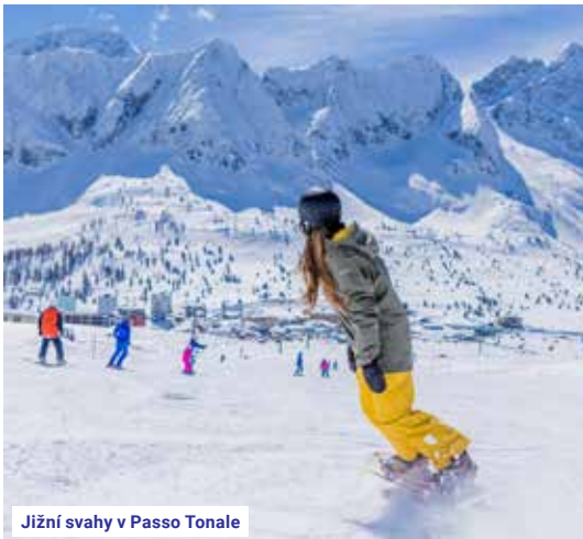
Jižní svahy v Passo Tonale

Upozornění: V turnusu 22 I-PT předávají klienti uklizené ubytovací jednotky v den odjezdu do 10 hod.! Odjezd ze střediska je kolem 19. hod.