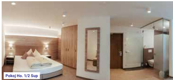
Pokoj Ho. 1/2 Sup