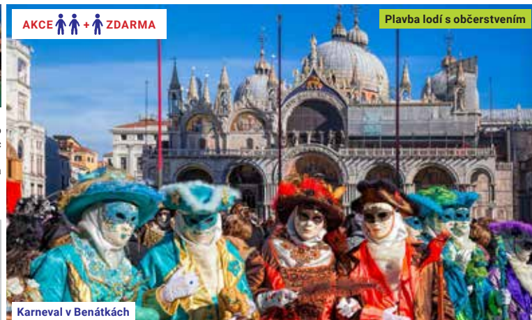
Karneval v Benátkách