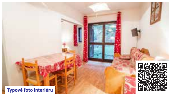
Typové foto interiéru

Cena v tabulce nezahrnuje: dopravu lux. busem (viz str. 6–7) • pobytovou taxu • cestovní pojištění (viz str. 5) • ručníky • čisticí a hygienické prostředky • průběžný a závěrečný úklid • kauci na apartmán