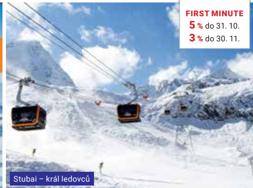
Stubai – král ledovců

Vše v 1 ceně Ubytování + polopenze + skipas + doprava