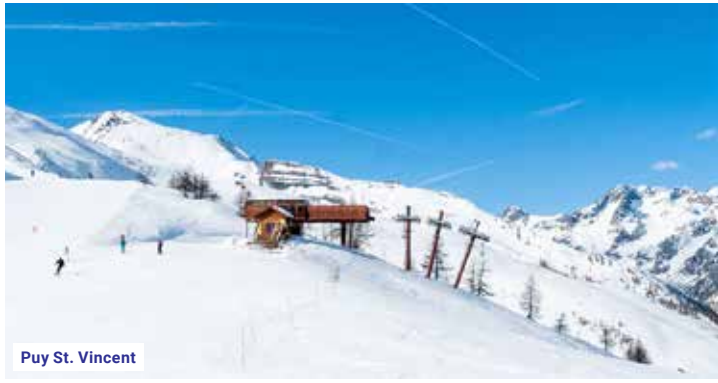
Puy St. Vincent