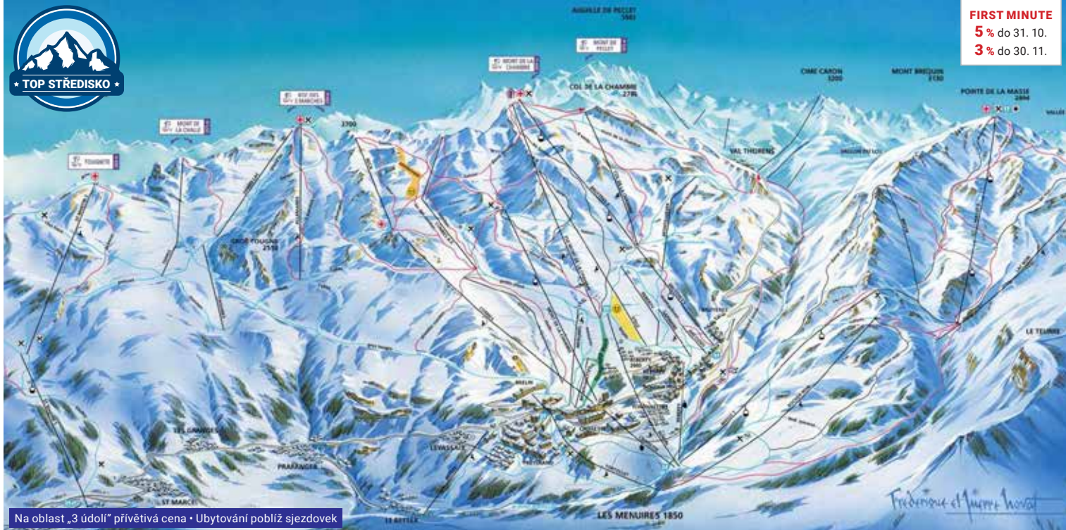
Na oblast „3 údolí“ přivítává cena • Ubytování poblíž sjezdovek

FIRST MINUTE 5% do 31. 10. 3% do 30. 11.