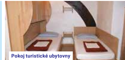
Pokoj turistické ubytovny