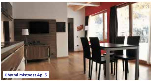
Obytná místnost Ap. 5