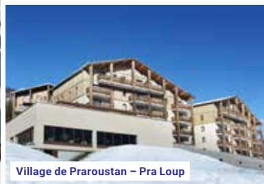
Village de Praroustan – Pra Loup