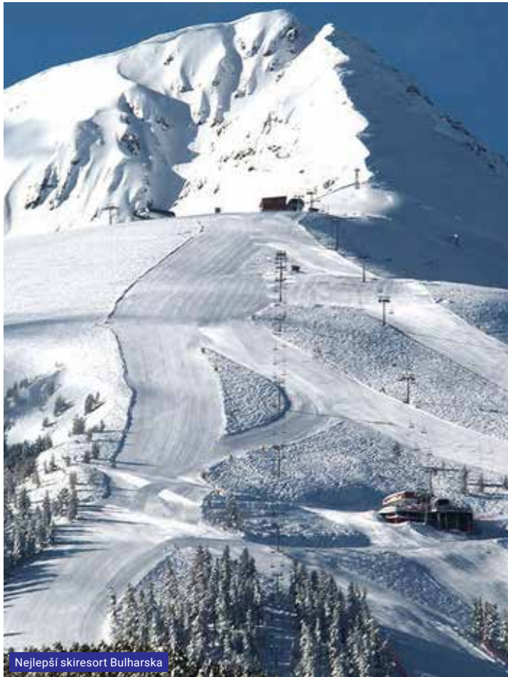
Nejlepší skiresort Bulharska