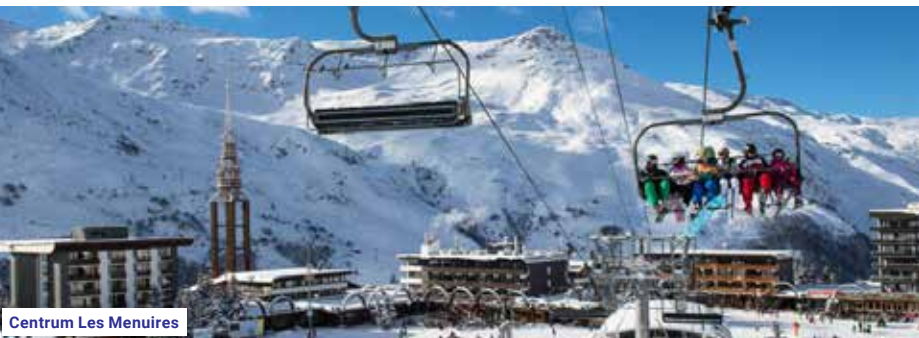
Centrum Les Menuires

Další možnosti střediska: venkovní vyhříváný bazén, kluziště, bary, restaurace, obchody, sportovní centrum s bazénem