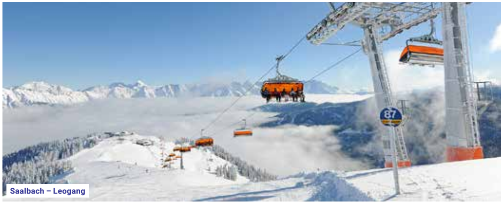
Saalbach – Leogang

Snowboarding: 9x snowpark Další možnosti střediska: snowtubingová dráha, noční lyžování, rekonstruovaný plavecký bazén v Zell am See, termální aquapark Tauern Spa Kaprun, večerní procházky kolem Zellerského jezera s návštěvou lázeňského městečka Zell am See