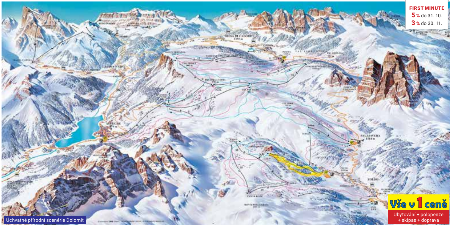
Úchvatné prírodné scenérie Dolomit

FIRST MINUTE 5% do 31. 10. 3% do 30. 11.