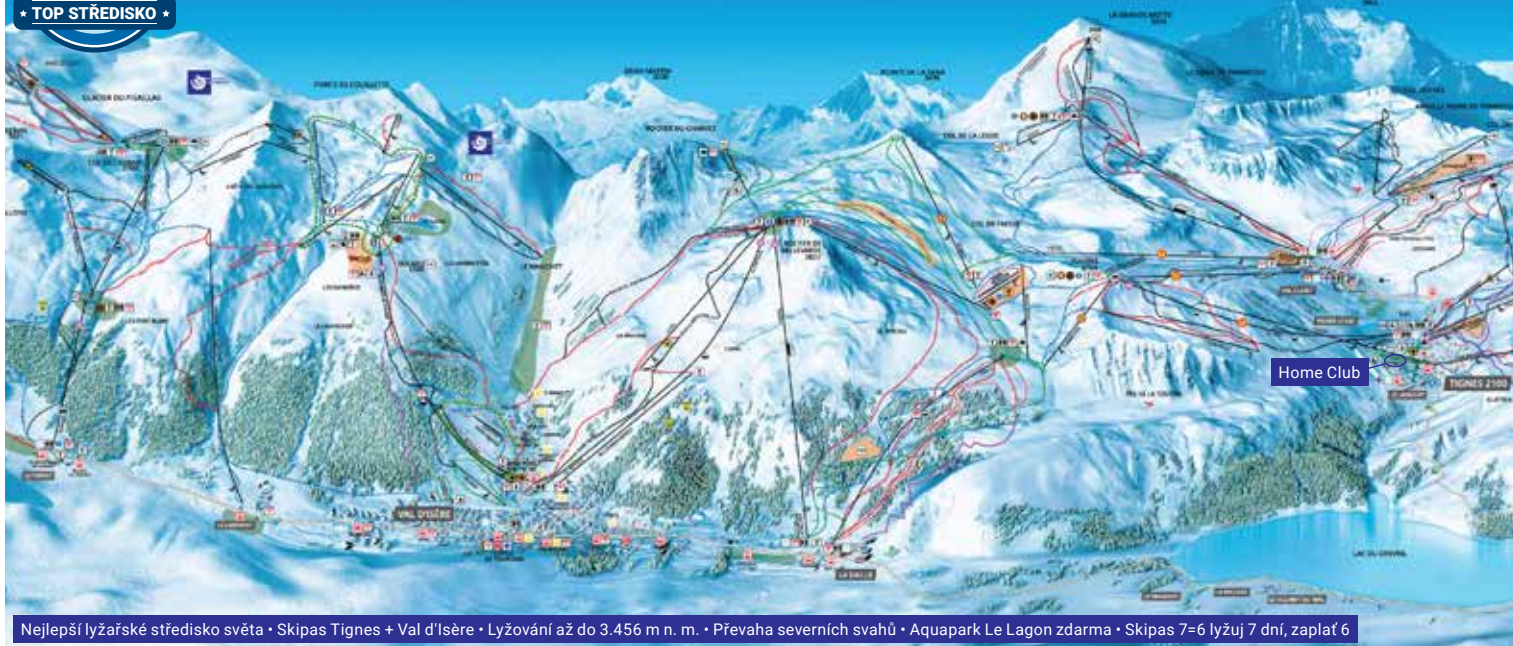
Nejlepší lyžařské středisko světa • Skipas Tignes + Val d'Isère • Lyžování až do 3.456 m n. m. • Převaha severních svahů • Aquapark Le Lagon zdarma • Skipas 7=6 lyžuj 7 dní, zaplat 6

FIRST MINUTE 5% do 31. 10. 3% do 30. 11.