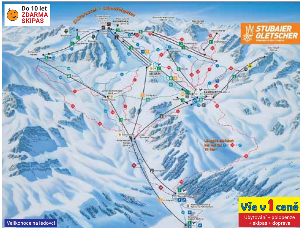
Velikonoce na ledovci

Vše v 1 ceně Ubytování + polopenze + skipas + doprava