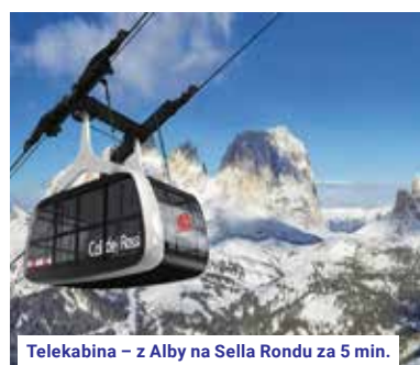
Telekabina – z Alby na Sella Rondou za 5 min.

Střední turnusy: Příjezdový den je nelyžařský. Odjezd autobusu z ČR v úterý v časných ranních hod. Příjezd do střediska mezi 18. a 19. hod. Ubytování bezprostředně po příjezdu. Odjezdový den je lyžařský. Přebíráni apartmánů do 10 hod. Odjezd autobusu v podvečerních hod., příjezd do ČR v neděli ráno. Účastníci s vlastní dopravou mají možnost rozšíření skipasu o 1 den – lyžování v den příjezdu. Ubytování je možné až mezi 17. a 19. hod. Do této doby není možné zajistit v rezidencích žádný apartmán, studio či jiný náhradní prostor!