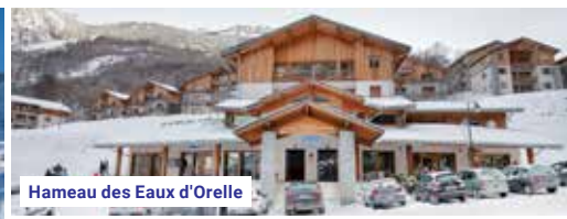
Hameau des Eaux d'Orelle