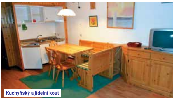
Kuchyňský a jídelní kout