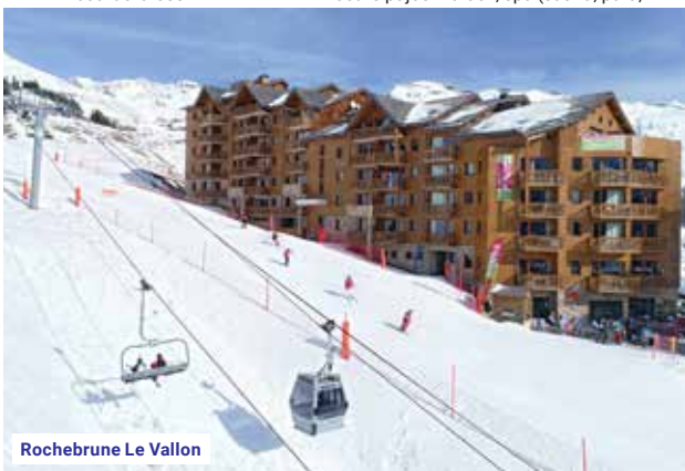
Rochebrune Le Vallon

Další možnosti střediska: paragliding, sněžnice, sáňkařská dráha, Igloo Kanata – stravení noci v horské vesnici, dětské školky, dětské parky Opouland a Waouland, sportovního centra L'Espace Grande Ours (cca 500 m od rezidence) – bazén s tobogánem, kaskádami a vodotrysky, kluzišť včetně půjčení bruslí, spa (sauna, pára, vířivka, solárium), bowling – vše za poplatek