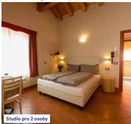
Studio pro 2 osoby

Upozornění: V turnusech 3, 4, 22 a 23 I-PL předávají klienti uklizené ubytovací jednotky v den odjezdu do 10 hod.! Odjezd ze střediska je kolem 19. hod.