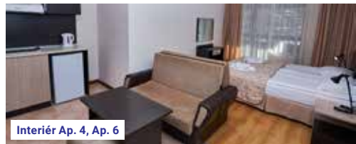
Interiér Ap. 4, Ap. 6

Snowboarding: 1x snowpark Další možnosti střediska: skialpinismus, lyžařské školy, muzeum Rilskeho-bulharského obrození