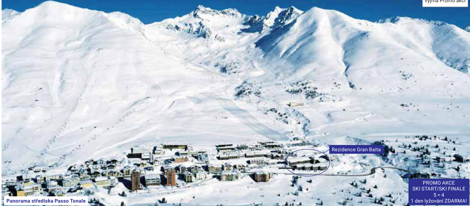
Panorama střediska Passo Tonale

FIRST MINUTE 15% do 31. 10. 10% do 30. 11. vyjma Promo akcí