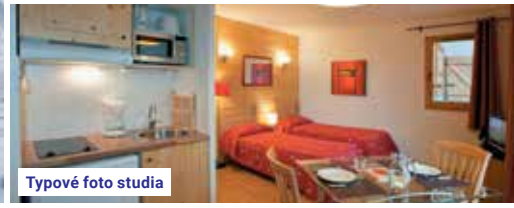
Typové foto studia