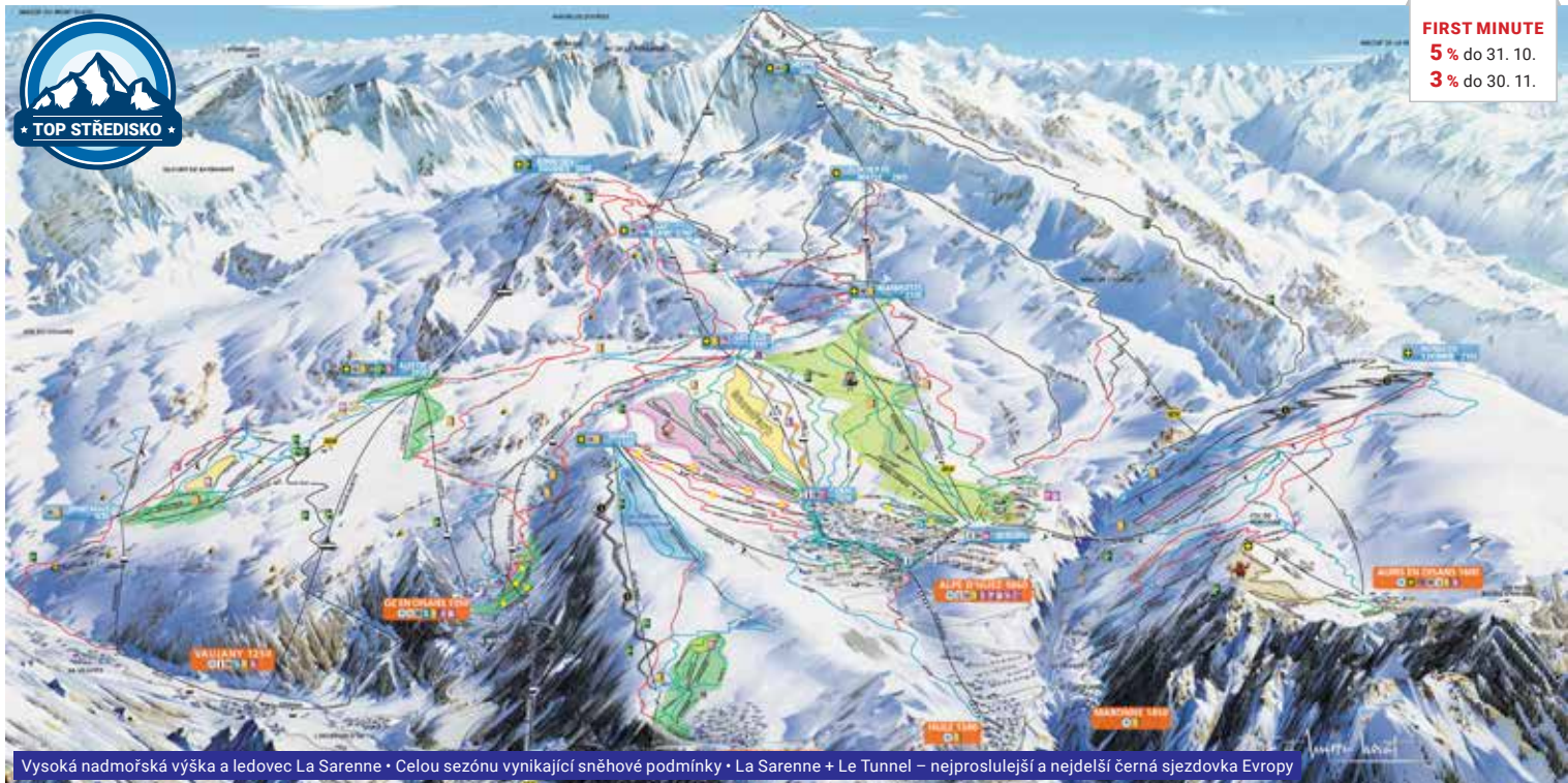
Vysoká nadmořská výška a ledovec La Sarenne • Celou sezónu vynikající sněhové podmínky • La Sarenne + Le Tunnel – nejproslulejší a nejdelší černá sjezdovka Evropy