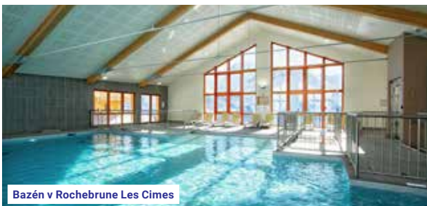
Bazén v Rochebrune Les Cimes