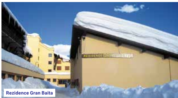
Rezidence Gran Baita