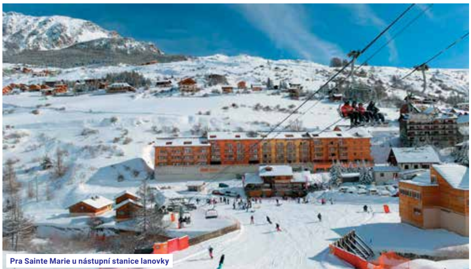
Pra Sainte Marie u nástupní stanice lanovky

Další možnosti střediska: kluziště, sáňkařská dráha, paragliding, restaurace, bary, obchody