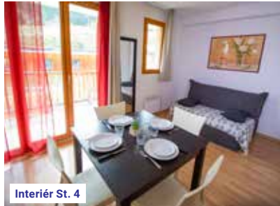
Interiér St. 4