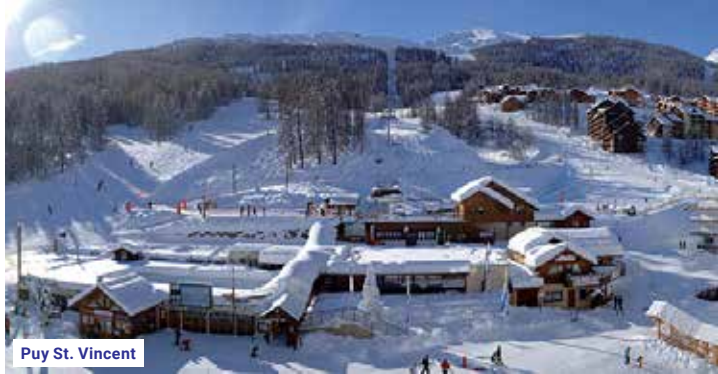
Puy St. Vincent